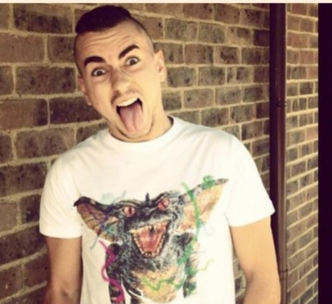
Jorge Lorenzo con un camiseta diseñada por Makelismos.